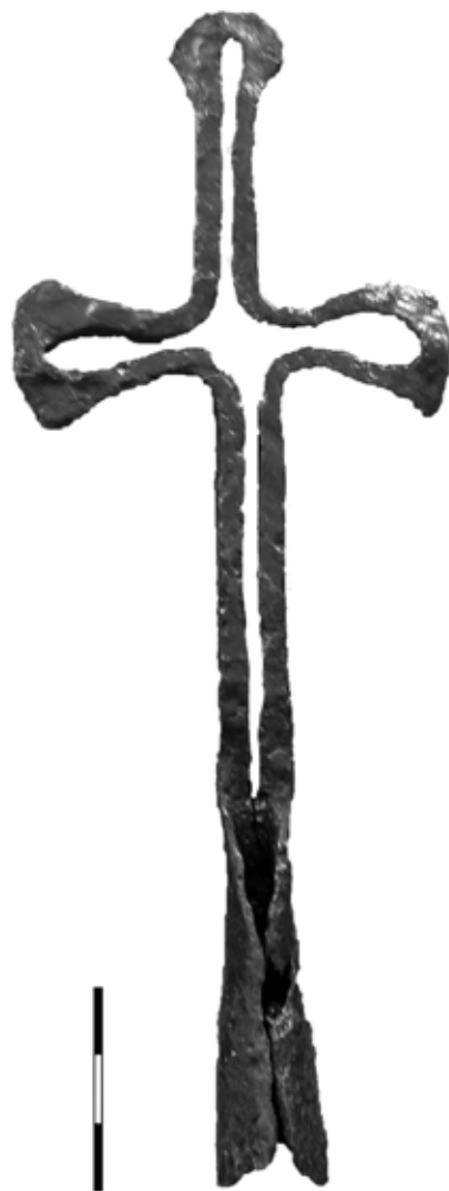
Обр. 2. Железен литиен кръст от сграда № 2, п. D, от XI–XII в.

Проучванията през 2014 г. потвърждават стратиграфията установена в предходните години. Наблюдават се общо три пласта. Първият е хумус от светлокафява силно песъчлива пръст. Вторият е дебел пласт от рушевини (ломени камъни и хоросан в горната си част и фрагментирана строителна керамика в долната), в който се откриват отделни фрагменти битова керамика. Третият пласт е над