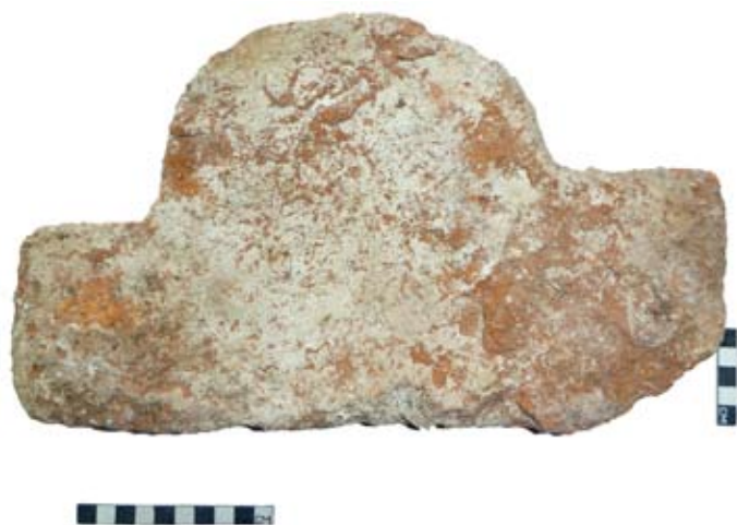
Обр. 3. Декоративна тухла.

подовото ниво и е с дебелина от около 0,50 м в близост до зидовете и около 0,25 м в останалата част. Запълнен е с хоросан, пепел, въглени от горели греди и е силно наситен с фрагменти от битова керамика и находки. В него са открити две монети на император Мануил I Комнин (1143-1180), едната от които е от пожара на пода в помещение В, а другата северно от входа на помещение D. Керамичният комплекс включва различни съдове – монохромно сграфито, керамика със златиста ангоба, „селадон“ и др., характерни за периода XI–XII в. Последният пласт маркира голям пожар, който слага край на живота в крепостта. Находките в него ни дават основание към момента да го датираме в края на XII в.