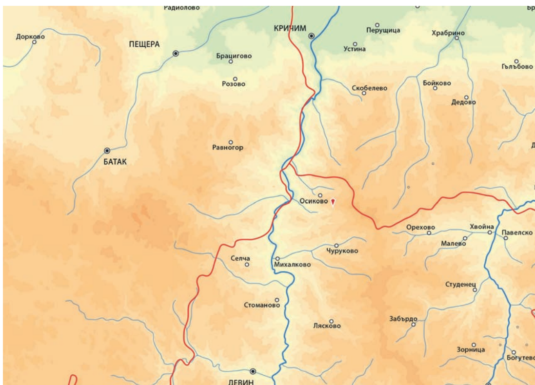
Обр. 1. Местоположение на обекта.

То се проведе в периода 17–24.07.2012 г., в рамките на шест работни дни. Проучването беше фи-