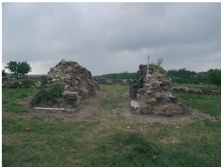
Обр. 2. Западната порта на манастира.

Обработката на керамичния материал и на находките, както и теренните наблюдения относно техниките и начина на градеж на манастира, позволяват да се изгради една работна хипотеза относно неговата датировка. Според екипът, ръководил археологическото наблюдение по време на зачистването, манастирския комплекс до с. Воден се отнася към периода на византийското владичество на българските земи и Второто българско царство: XI–XIII в.