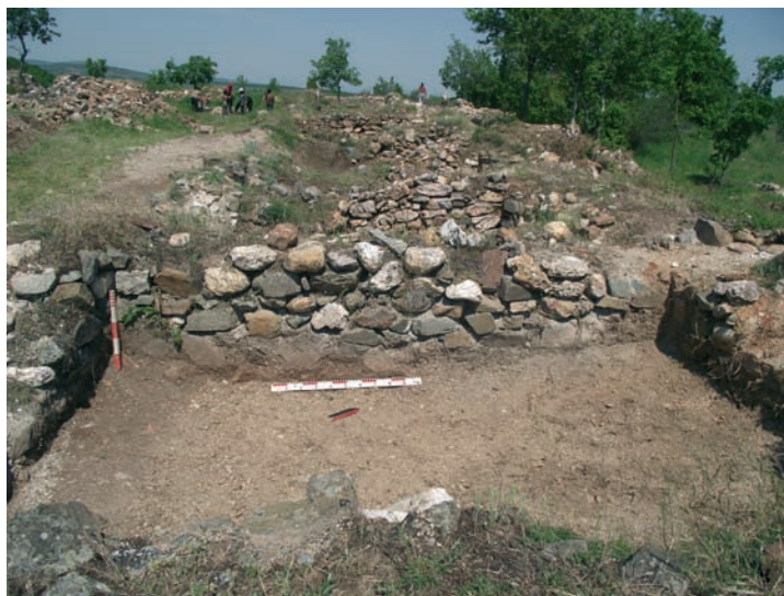
Обр. 3. Сграда 1.